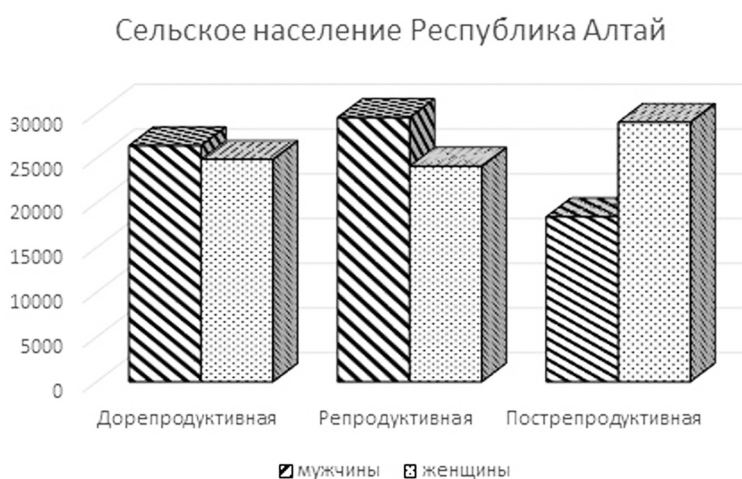
Рисунок 4. Возрастные когорты в сельских популяциях Республики Алтай Figure 4. Age cohorts in rural populations of the Altai Republic