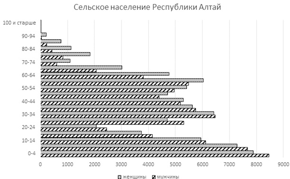
Рисунок 2. Распределение половозрастных групп в сельских популяциях Республики Алтай на 01.01.2016 Figure 2. Distribution of sex and age groups in rural populations of the Altai Republic as at 01.01. 2016