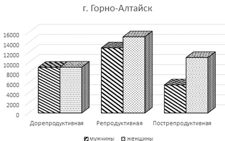
Рисунок 3. Возрастные когорты в популяции Горно-Алтайска Figure 3. Age cohorts in the Gorno-Altaysk population